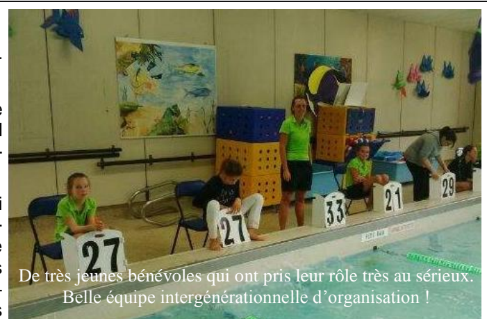
De très jeunes bénévoles qui ont pris leur rôle très au sérieux. Belle équipe intergénérationnelle d'organisation !