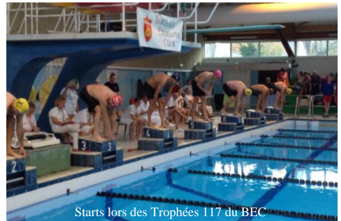
Starts lors des Trophées 117 du BEC

Le « Trophée 118 » est dans les cartons si tout va bien !