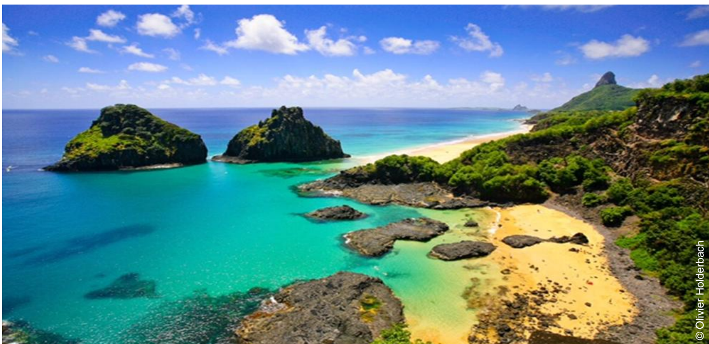
Fernando de Noronha

Et parmi les disciplines de la natation, l'eau libre est ainsi beaucoup plus appréciée que la natation en bassin. Cette discipline est bien aidée en cela par les nombreuses plages et îles de rêve ici. Faire la traversée de l'Ilha do Mel ou de Fernando de Noronha (une des plus belles îles du monde) fait évidemment rêver.