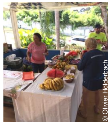
Stand de fruits et de friandises à volonté sur une compétition locale