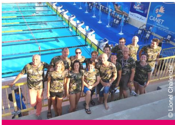
ES NANTERRE, 3 e (433 points)