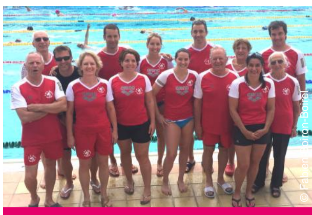
EMS BRON, 6 e (322 points)