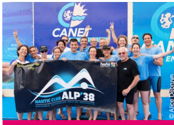
NAUTIC CLUB ALP'38, 4 e (382 points)