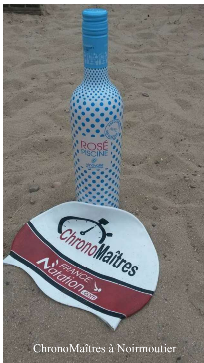
ChronoMaîtres à Noirmoutier

Les contributeurs des précédents numéros ont profité des vacances pour faire voyager le bonnet ChronoMaîtres offert par France Natation. Merci à eux pour ces cartes postales enthousiastes et ensoleillées !