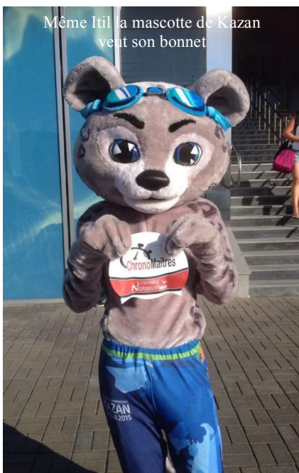
Même Itil la mascotte de Kazan veut son bonnet